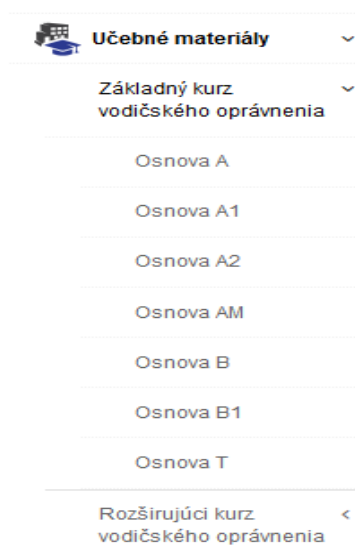
Obr. 1 Učebné materiály v navigačnom menu

Ako inštruktor máte prístup k učebným materiálom a to cez navigačné menu v ľavej časti, položka Učebné materiály.