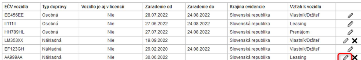
Obrázok 7 - úprava údajov vozidla